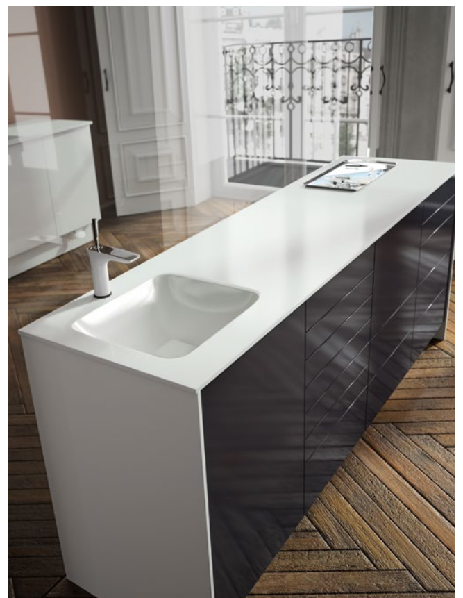
Plan de travail et côtés en Solid Surface Solid Surface worktop and side